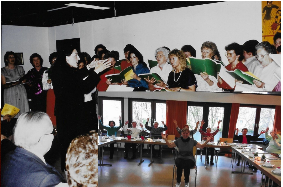
Dühren 1979 – 1984

H err, du hast deine menschliche Gestalt angenommen. Gib, daß wir zu Menschen werden, die nicht nur von dir leben, sondern die Liebe deines Wortes gestalten, die Liebe deines Lebens lassen im Umgang miteinander und mit anderen Menschen. Werden wir Jesus nachfolgen und in seiner Nachfolge gehandelt werden und deine Gebote tun und deine Gebote tun können wir werden, dann sind wir deine Gemeine.