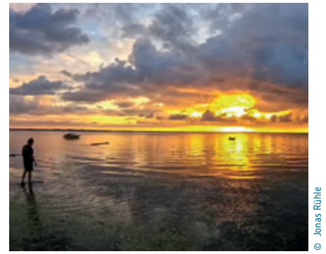
Sommerfreizeit 2024 in Dänemark