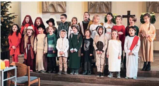
Kinderchöre beim Weihnachts-Krippenspiel

Das Publikum darf sich jetzt schon auf eine Vorstellung mit schillernden Seifenblasen, galoppierend Zirkuspferden, der Seiltänzerin Graziosa und mehr freuen. Manege frei heißt es am 27. Juli im Rahmen des Gemeindefestes in der Stadtkirche .