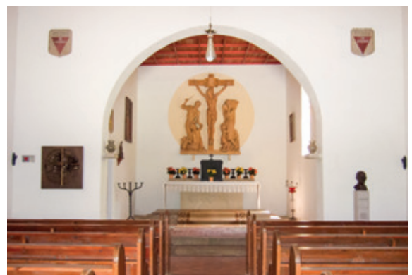
Altar in der Sühnekapelle Flossenbürg mit Bonhoeffer-Büste